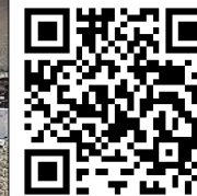
Scannez ce QR-Code