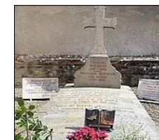
Pierre tombale de Ferdinand Berthier